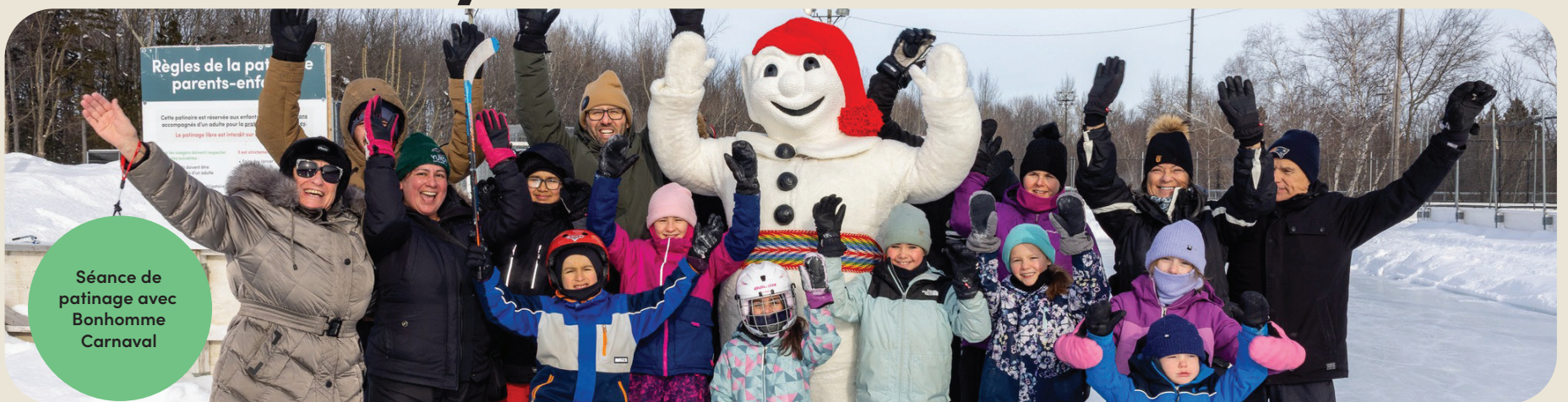
Séance de patinage avec Bonhomme Carnaval