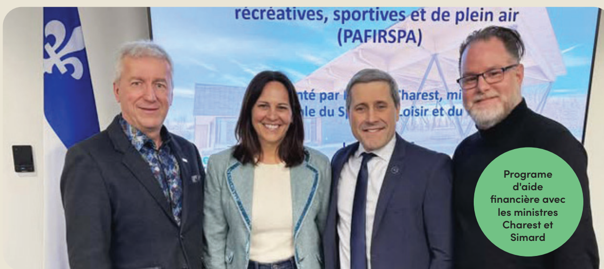
Programme d'aide financière avec les ministres Charest et Simard