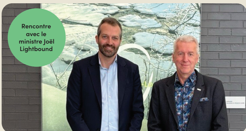
Rencontre avec le ministre Joël Lightbound