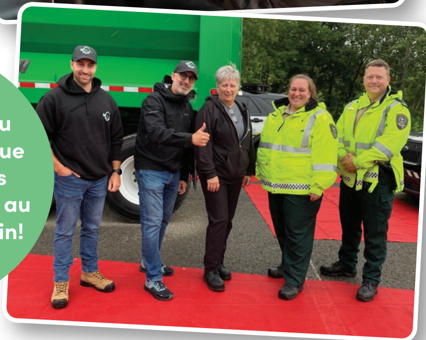
Photo prises au populaire kiosque du Service des travaux publics, au Festival Lorettain!

Pour l'horaire et les détails de la journée, surveillez notre page Facebook et notre site Internet.