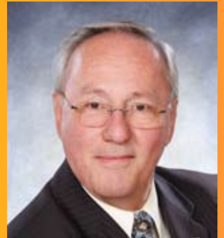
Bonne et heureuse année 2009 Le maire de L'Ancienne-Lorette

Que la santé vous accompagne chaque jour et que chaque instant soit pour vous source de sérénité et d'allégresse.