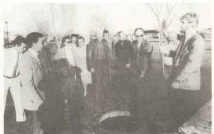
Au soleil couchant, le mardi 14 mai, plantation solennelle et joyeuse d'un pommier décoratif au parc Cyrille Gauvin. Le maire a saisi la pelle, le conseiller Fauchon amène l'arbre pendant que les membres du Conseil et ceux de la Commission d'embellissement y vont de leurs joyeux encouragements. C'est le coup d'envoi de nos efforts collectifs en matière d'embellissement.