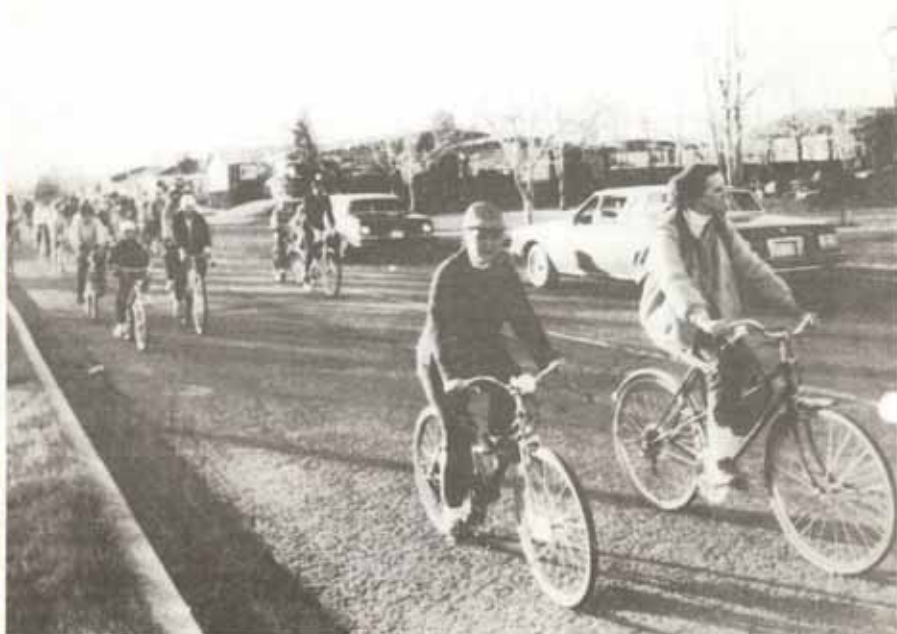
La randonnée cycliste est devenue une réalité importante à l'Ancienne-Lorette. Chaque mardi, le peloton part pour une destination nouvelle. C'est du cyclisme familial où on ne cherche pas les performances; une excellente initiative à la portée de tous.