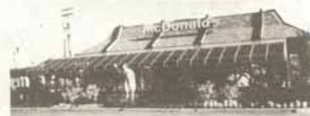
Premier prix, catégorie commerce: Le McDonald.