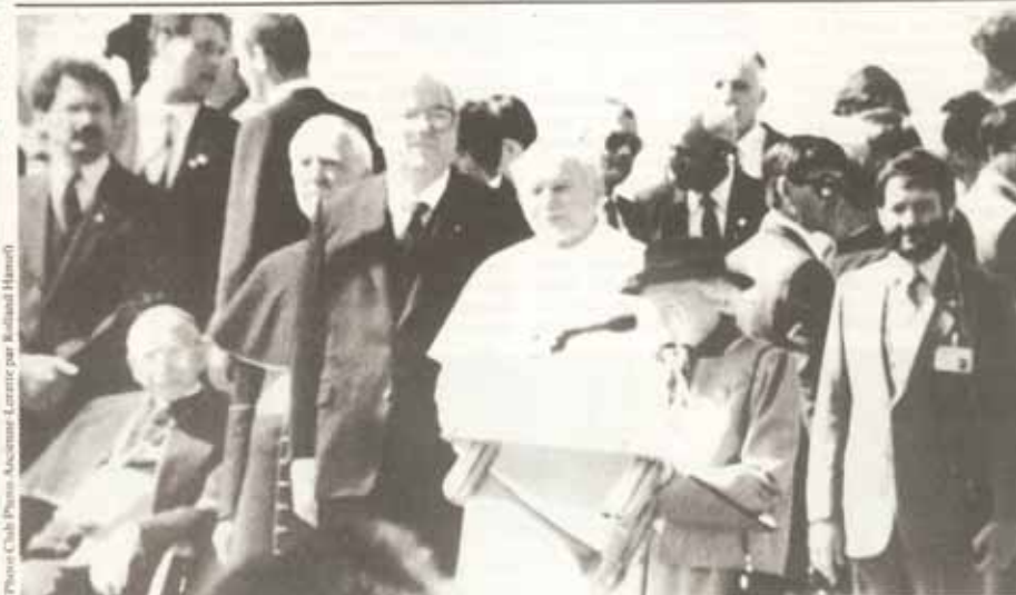
C'est sur le sol de la paroisse de l'Ancienne-Lorette que le Saint Père a d'abord mis les pieds lors de son voyage "pèlerinage" au Canada. On voit ici le Gouverneur Général Mme Jeanne Sauvée lui souhaitant la bienvenue.