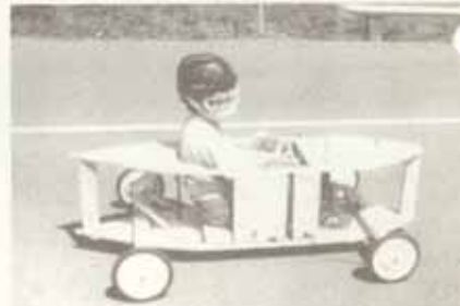
La course de tacots dans le côté St-Olivier, des émotions à revivre!