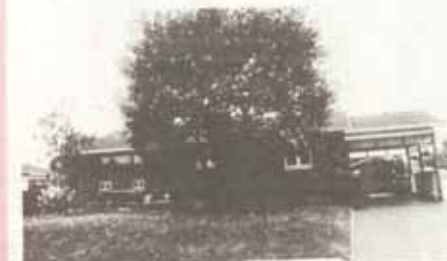
La plus belle pelouse: Gilles Drouin, 1650, rue Grandbois.