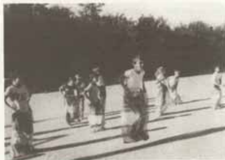
La course est engagée, l'affaire est dans le sac!