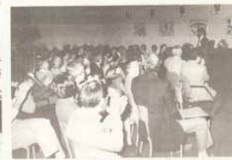
La salle du conseil était remplie. Un goûter a été servi.