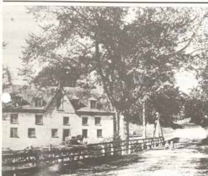
Moulin construit en 1674 par les Jésuites.