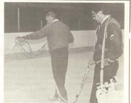
Depuis quelques semaines déjà, les préposés à la patinoire de l'Amphiglace s'affairent à mettre la touche finale pour l'ouverture officielle de la saison le 4 octobre.